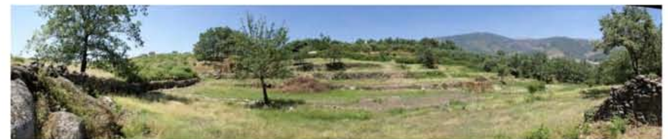
Panorámica recíproca a la anterior. Se pueden observar todas las edificaciones existentes, así como las padrejas situadas en toda la ladera que conforma la mitad oeste de la parcela.