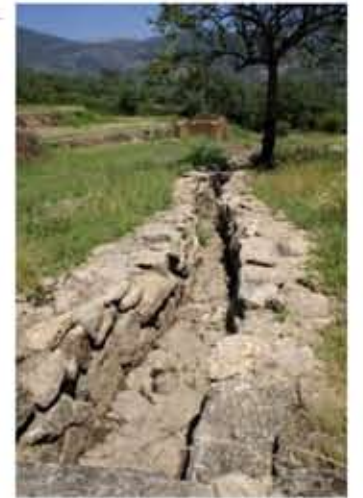
Detalle de la acequia que divide en dos la finca.

Dado que la olla por la que discurre el agua parte en dos la parcela, y todas las edificaciones se concentran en el extremo oeste de la misma, se pretende dejar la mitad oriental de la finca con un tratamiento mucho más salvaje, dejando apenas un área más abierta de merendero, y tupiendo con arbolado el resto de dicha mitad.