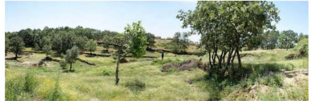
Vista desde el oeste hacia el acceso a la parcela y el lindero de la misma con el camino.