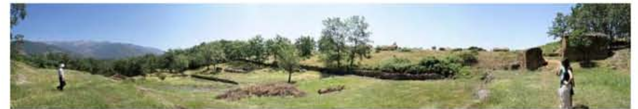
Panorámica de la finca desde el oeste. A la derecha, una de las edificaciones preexistentes y el cobertizo. Entre ellas, el acceso a la finca.