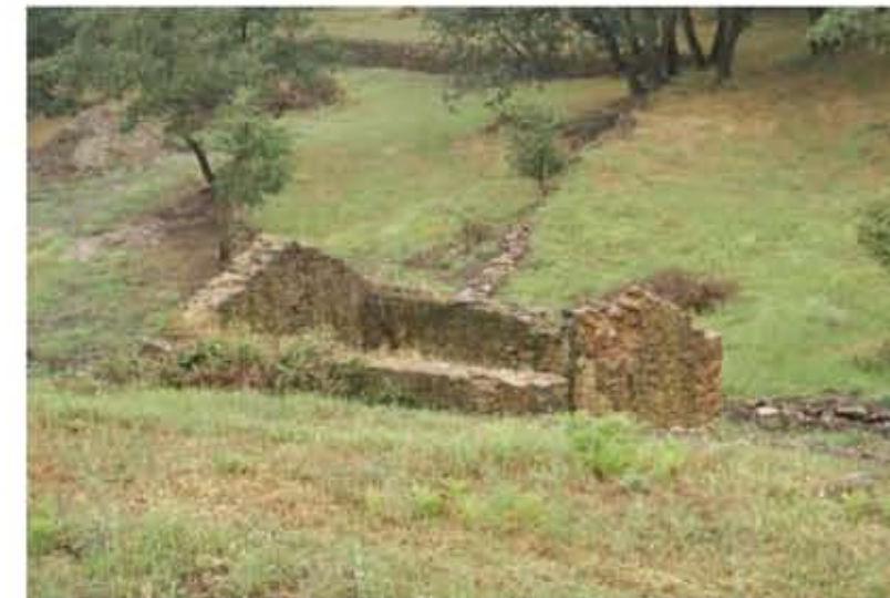
Detalle de luna de las edificaciones derruidas, en concreto, la situada a una cota más baja.