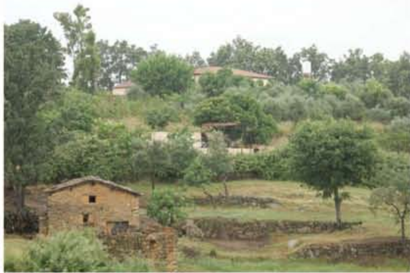
Vista desde el camino de acceso hacia la casa situada junto a la entrada a la parcela. Justo delante de ella, las ruinas del pequeño cobertizo. En segundo plano, una vivienda unifamiliar, con piscina y áreas ajardinadas, todo ello emplazado en el predio adyacente a la finca por el oeste. Nótese la gran pendiente del terreno.