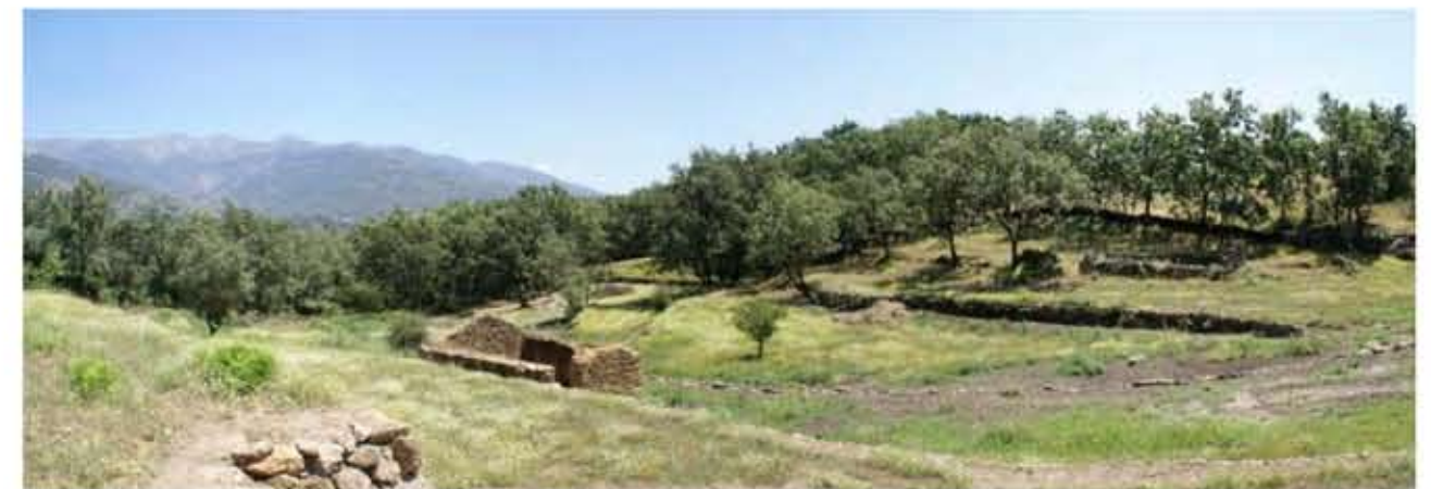
Vista hacia el norte. Se puede observar la acequia reconstruida en la olla para canalizar las aguas de escorrentía. En primer plano, una de las edificaciones preexistentes.